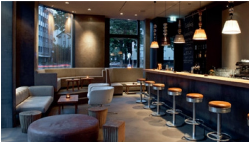
Café Bar Schmuklerski, Badenerstr. 101, 8004 Zürich