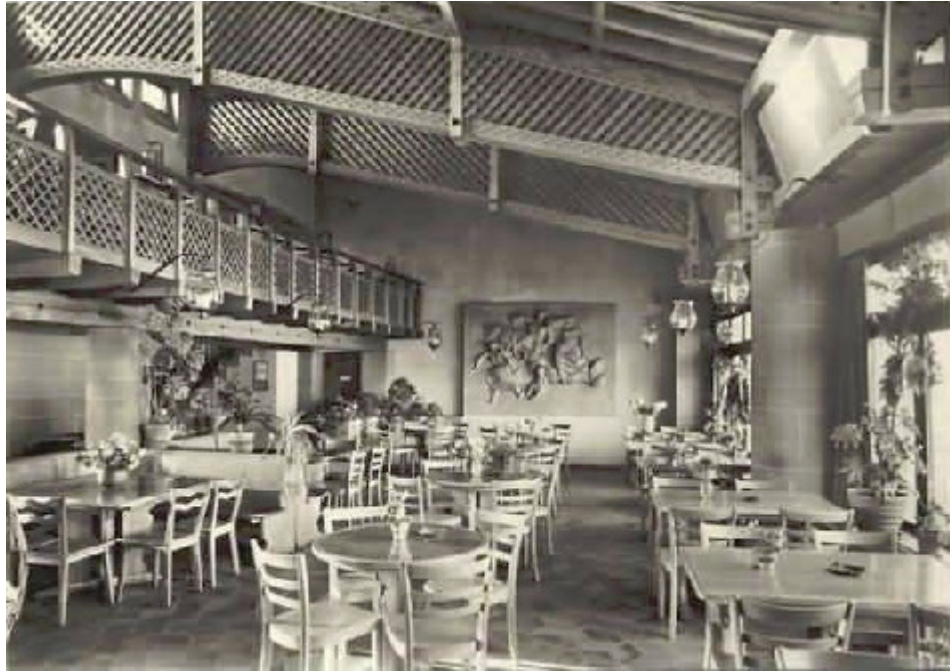
Historische Aufnahme des Migros-Restaurants „Guggi“, Limmatstr. 152, 8005 Zürich