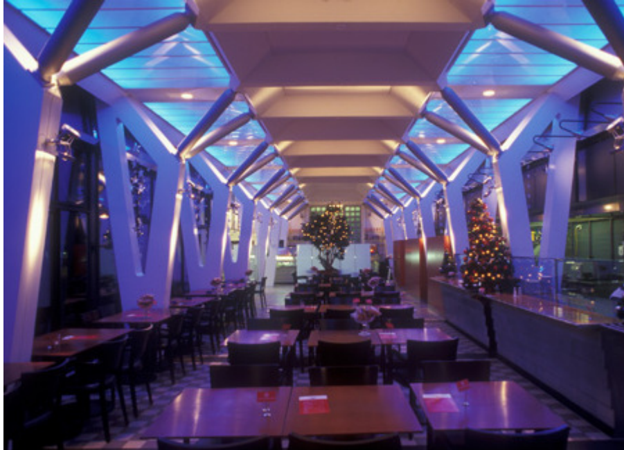
Rest. Olivenbaum, Stadelhoferstr. 10, 8001 Zürich (heutiger Zustand im Innern)