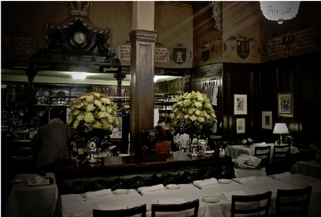
Kronenhalle, Rämistr. 4, 8001 Zürich