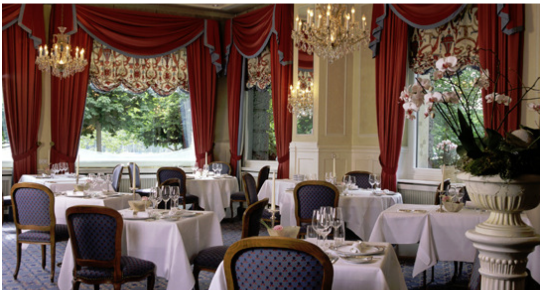
Restaurant des Hotels Eden au Lac, Utoquai 45, 8008 Zürich