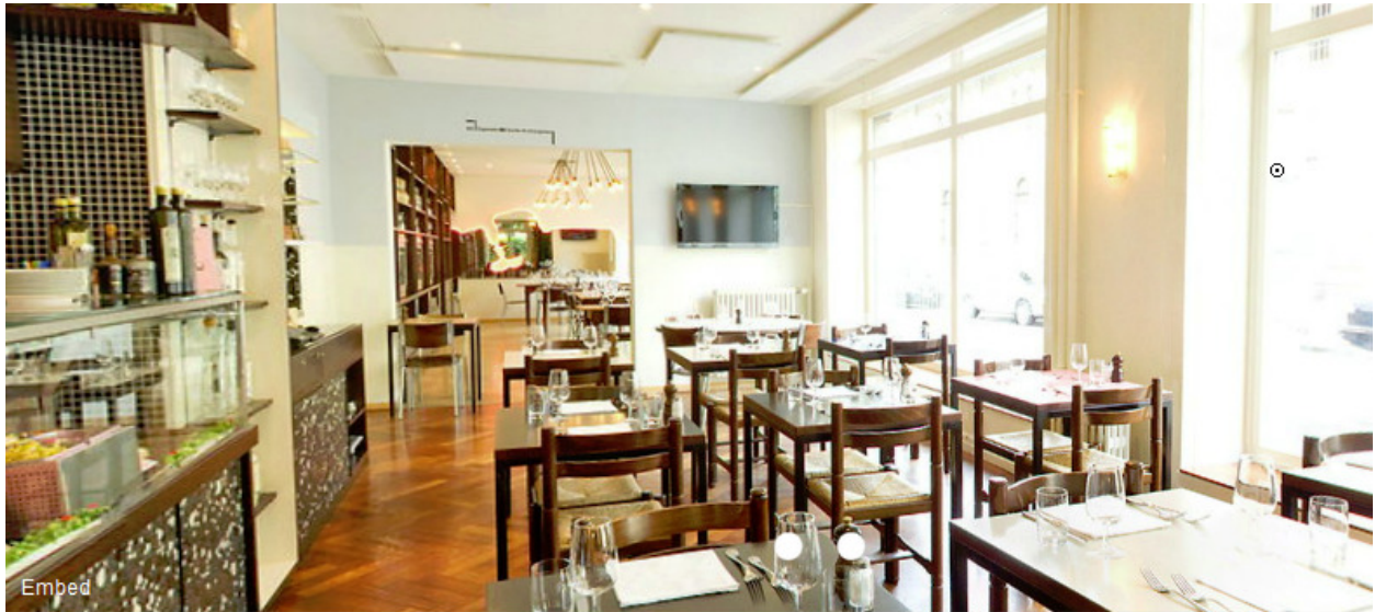
Italia, Zeughausstr. 61, 8004 Zürich