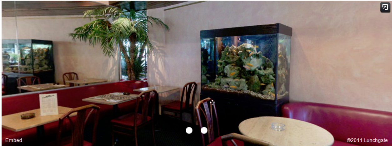
Café Ferdinand, Gutstr. 2, 8055 Zürich