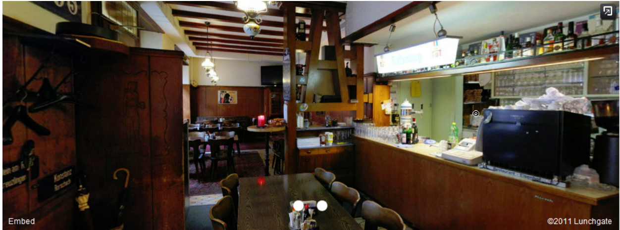
Eisenhof, Gasometerstr. 20, 8005 Zürich