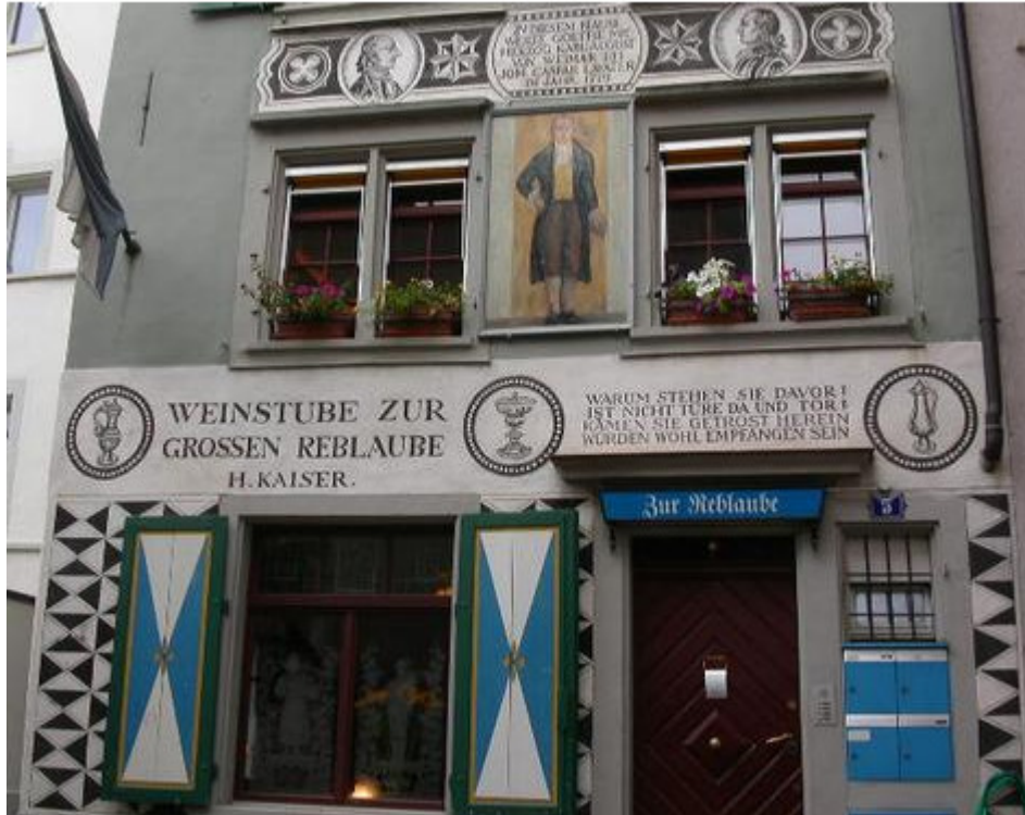
Reblauben mit Goethe-Stübli, Glockengasse 7, 8001 Zürich