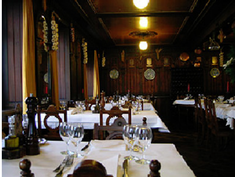
Bodega Espanola, Münsterergasse 15, 8001 Zürich