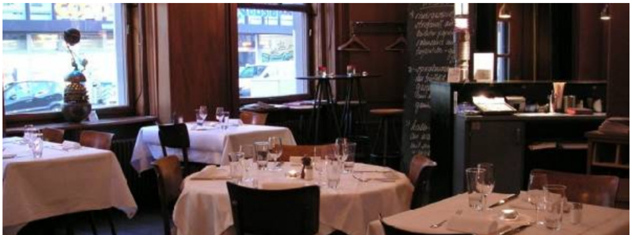
Hermannseck, Birmensdorferstr. 58, 8004 Zürich