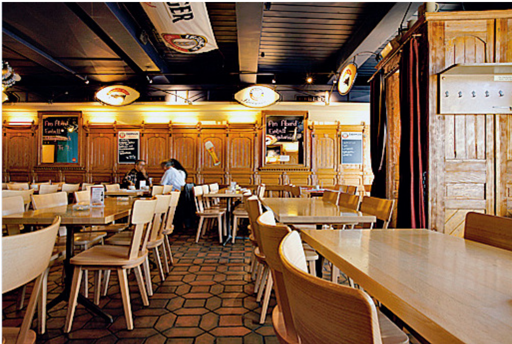
Bierhalle Wolf, Limmatquai 1932, 8001 Zürich