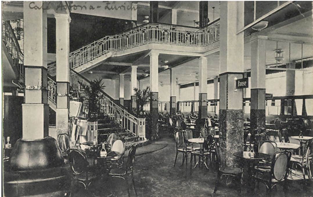
Ehem. Grand Café Astoria, Ecke Bahnhofstrasse/St. Peter-Straße (1918)

Café, Tea-Room, „Temperenzler“-Restaurant