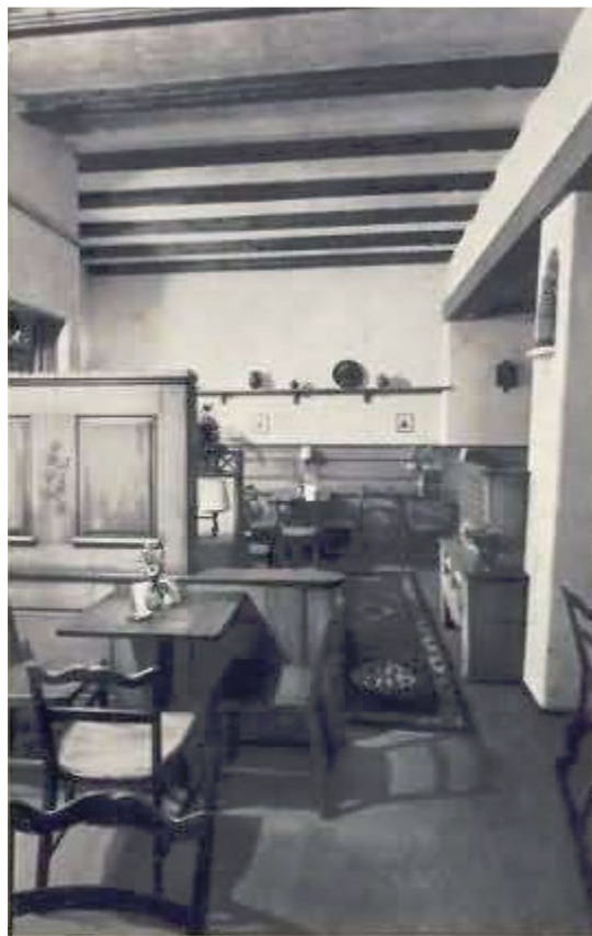
Ehem. Tea-Room Laterne, Spiegelgasse 12, 8001 Zürich