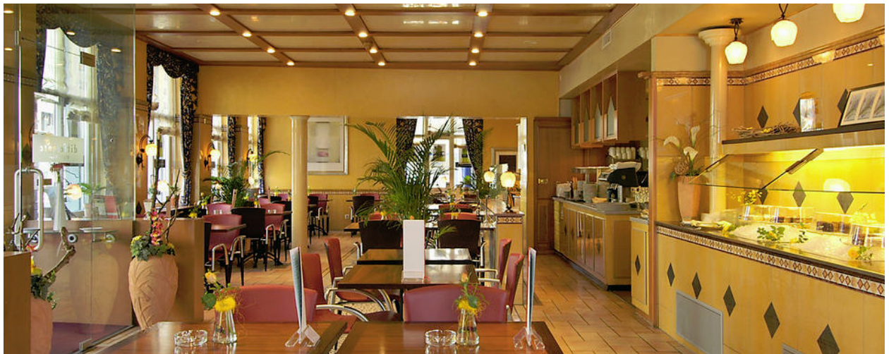
Rest. des Hotels Krone Unterstrass, Schaffhauserstr 1, 8006 Zürich