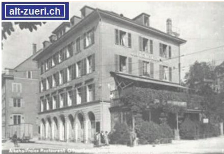
Alkoholfreies Restaurant Olivenbaum im Jahre 1920 (Stadelhoferstr. 10, 8001 Zürich).