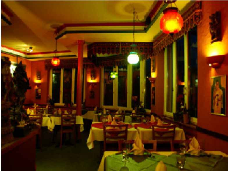
Südindisches Rest. Kerala, Hofwiesenstr. 188, 8057 Zürich, war ursprünglich ein typisches Tea-Room der 50er-Jahre.