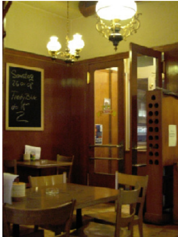
Metzgerhalle, Schaffhauserstr. 354, 8050 Zürich