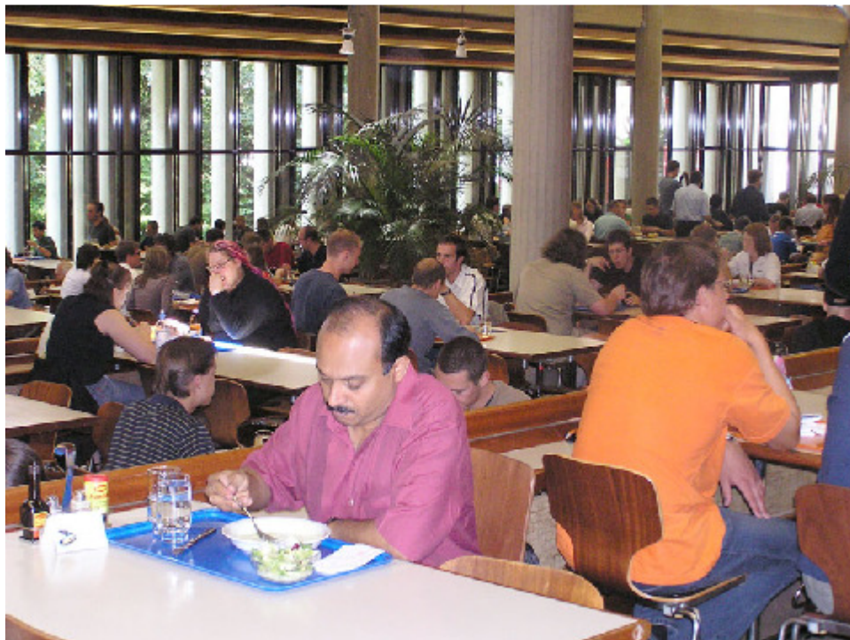
Mensa der ETH Zentrum