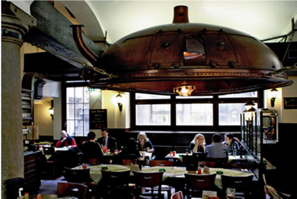
Johanniter, Niederdorfstr. 70, 8001 Zürich

Gasthaus, Gasthof, Schenke Wirtschaft, Wirtshaus