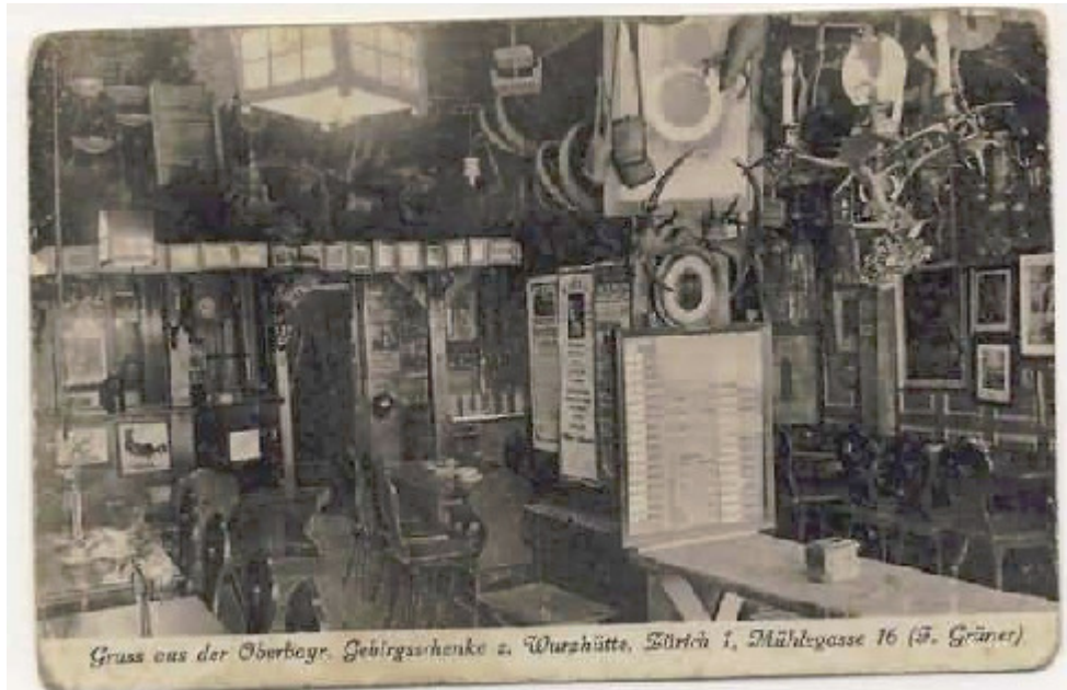
Ehem. Gebirgsschenke z. Wurzhütte, Mühlegasse 16, 8001 Zürich