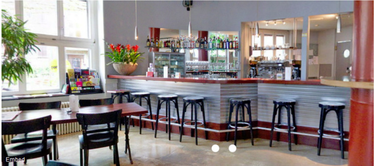
Café Boy, Kochstr. 2, 8004 Zürich