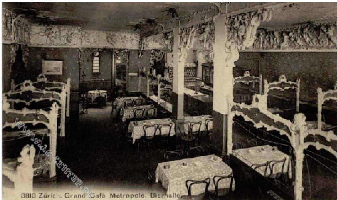
Ehem. Grand Café Metropol am Stadthausquai, 8001 Zürich