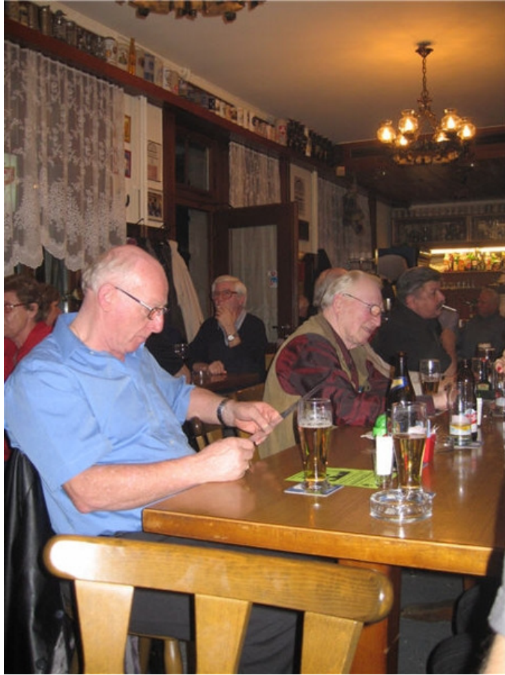
Farbhof, Badenerstr. 753, 8048 Zürich