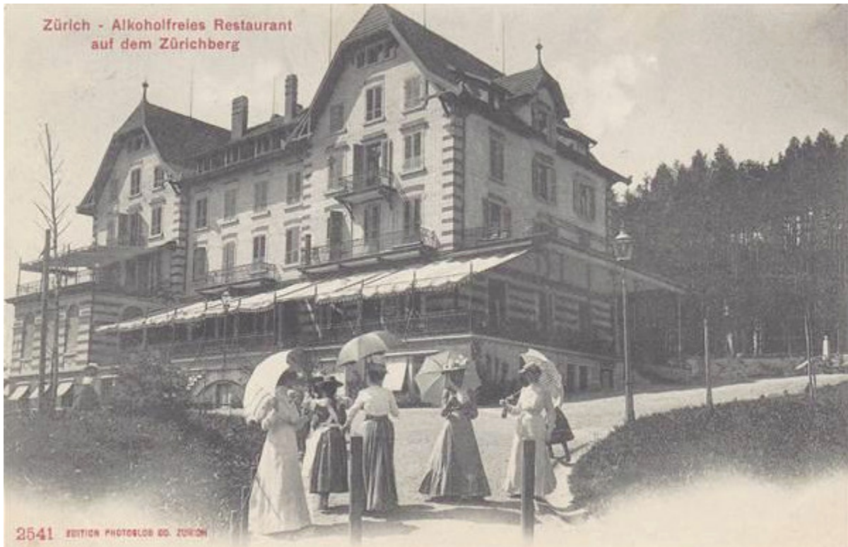
Alkoholfreies Kurhaus, Orellistr. 21, 8044 Zürich, 1899 und heute