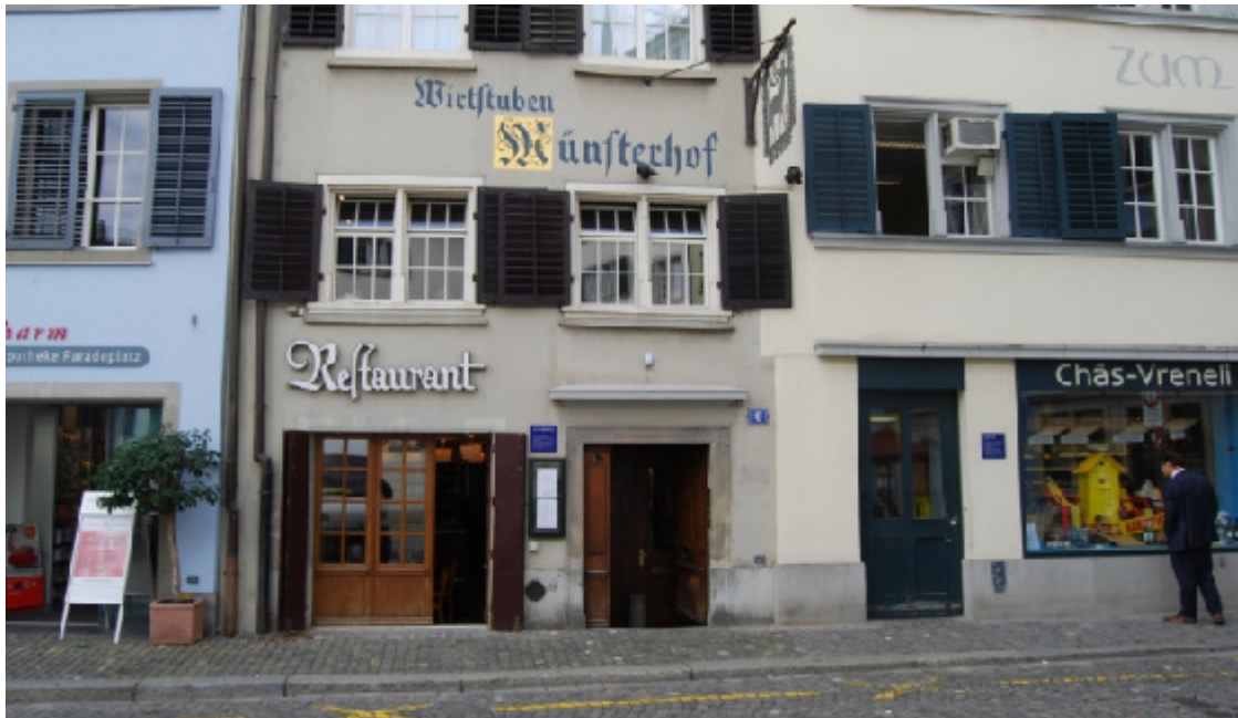
Münsterhof, Münsterhof 6, 8001 Zürich