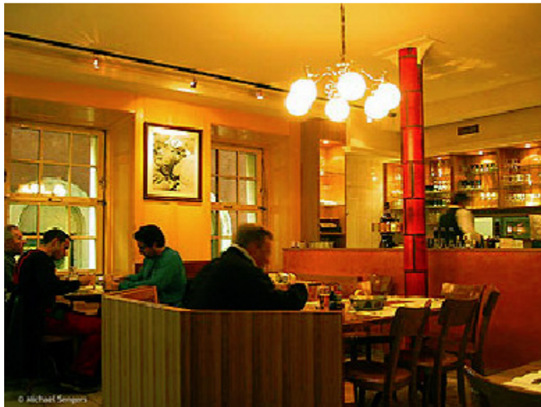
Rheinfelder Bierhaus alias „Bluetige Duume“, Marktgasse 19, 8001 Zürich