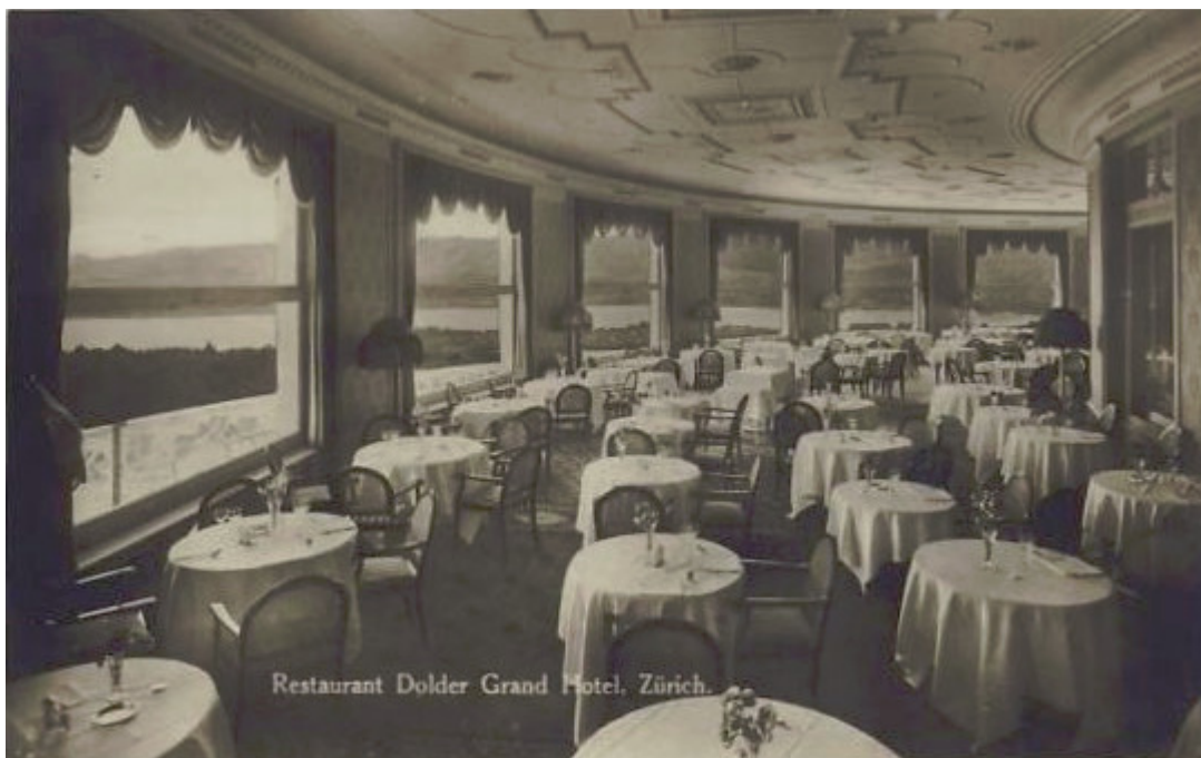
Hist. Aufnahme des Großen Saales des Rest. des Grand Hotels Dolder, Kurhausstr. 65, 8032 Zürich