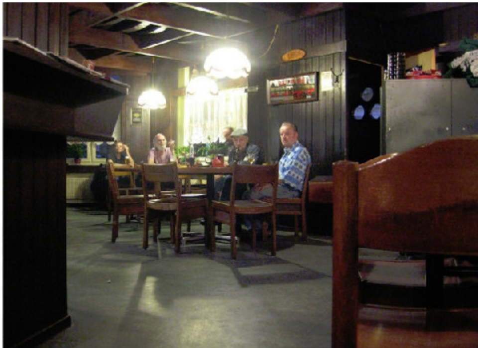
Scheidegg, Kehlhofstr. 2, 8003 Zürich