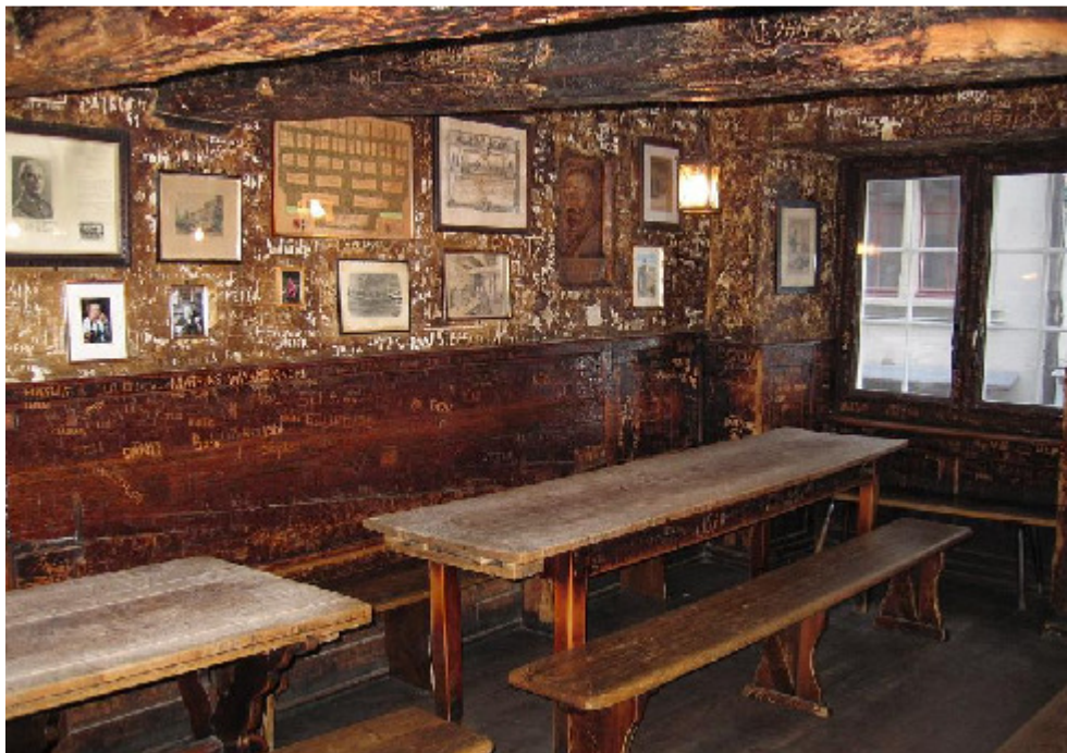
Oepfelchammer ("Öli"), Rindermarkt 12, 8001 Zürich