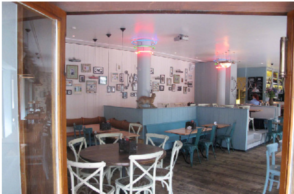
Iroquois, Seefeldstr. 120, 8008 Zürich