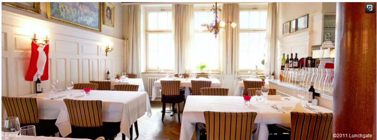
Bernerhof, Zeughausstr. 1, 8004 Zürich