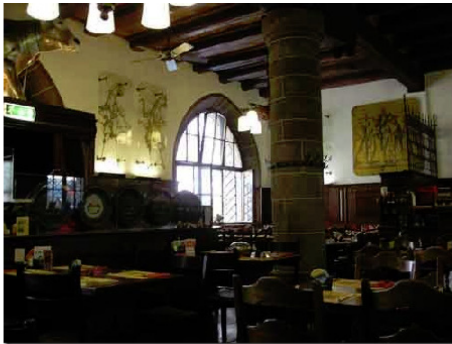
Zeughauskeller, Bahnhofstr. 28a, 8001 Zürich