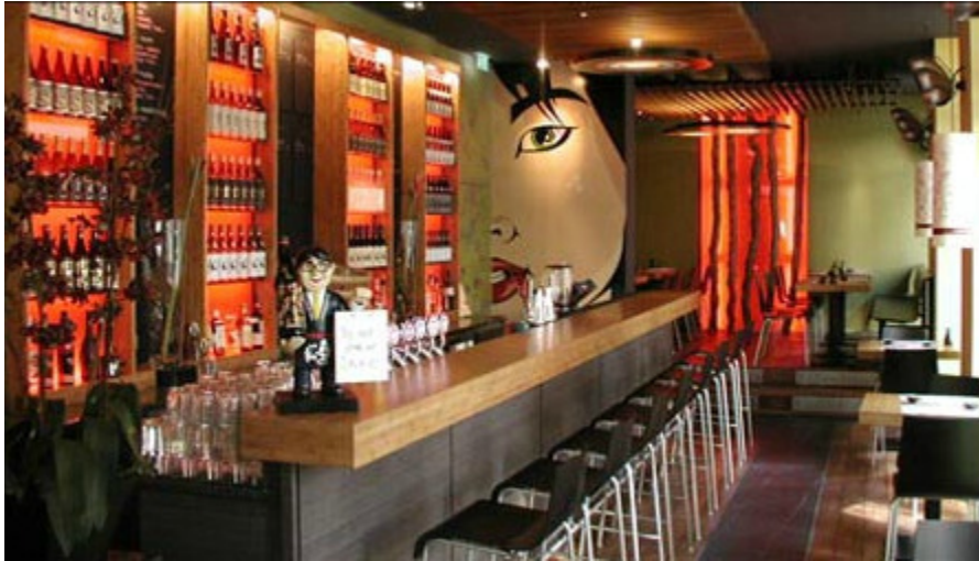
Yoojis, Josefstr. 112, 8005 Zürich