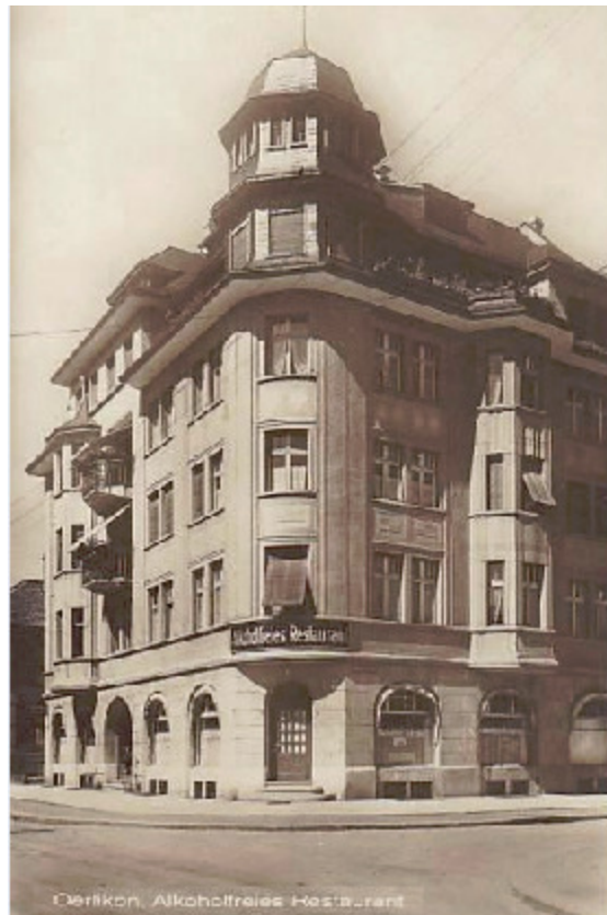
Ehem. alkoholfreies Restaurant in Oerlikon, (nicht lokalisiert) o.J.