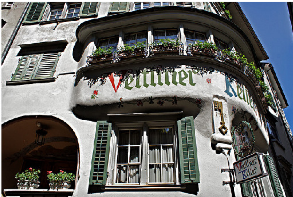
Veltliner Keller, Schlüsselgasse 8, 8001 Zürich