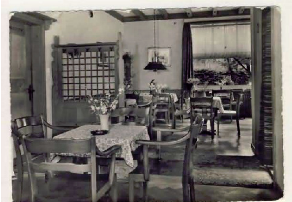
Innenaufnahme des ehem. alkoholfreien Cafés Rosatsch, Zürich-Seebach