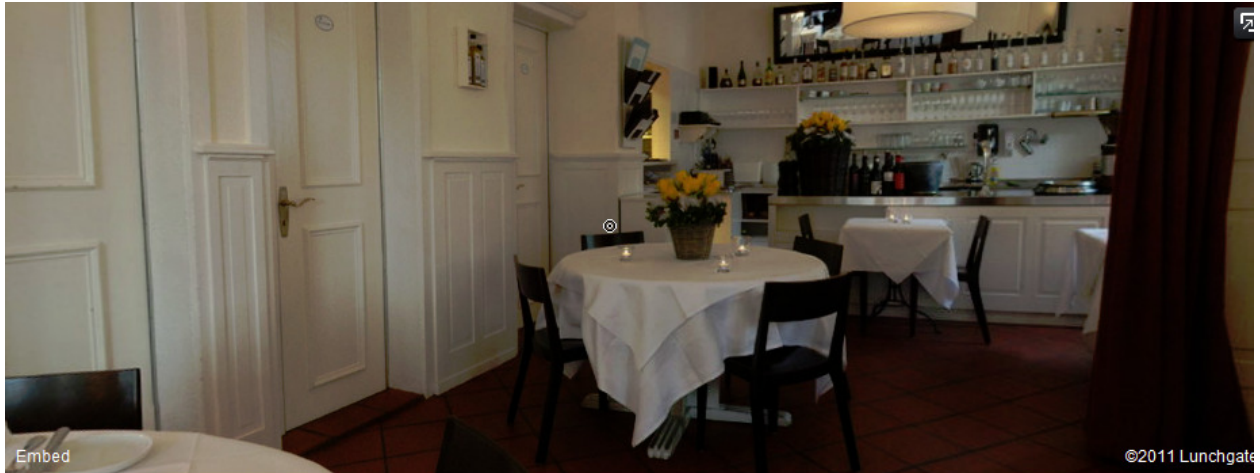
Idaburg, Gertrudstr. 44, 8003 Zürich