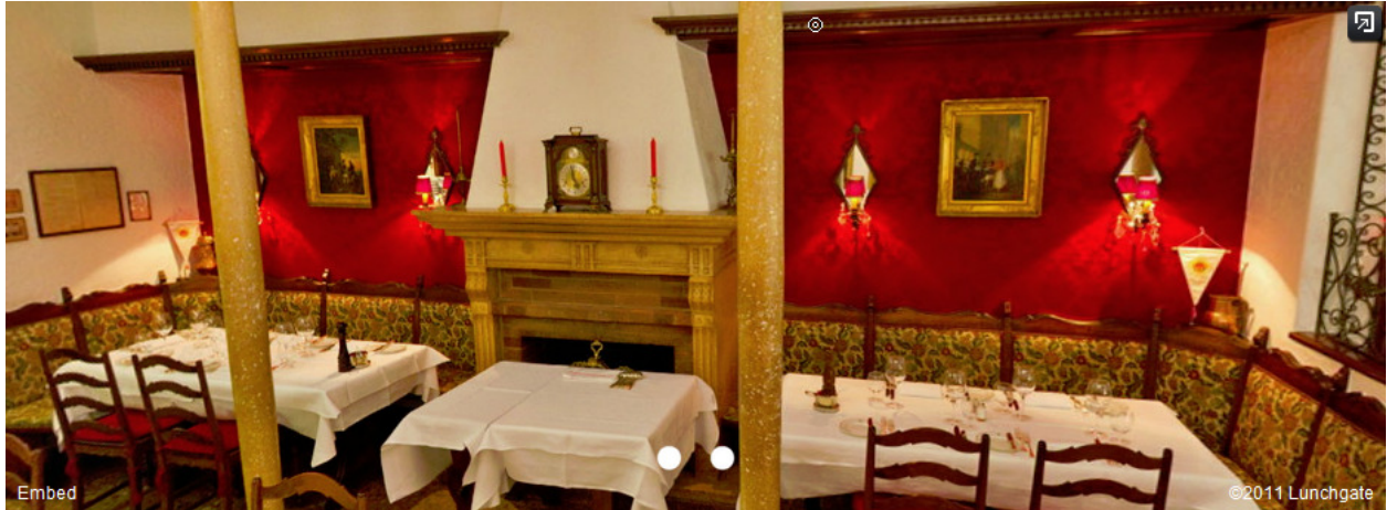
Casa Ferlin, wo u.a. der Schah von Persien oft zu Gast war. Stampfenbachstr. 38, 8006 Zürich