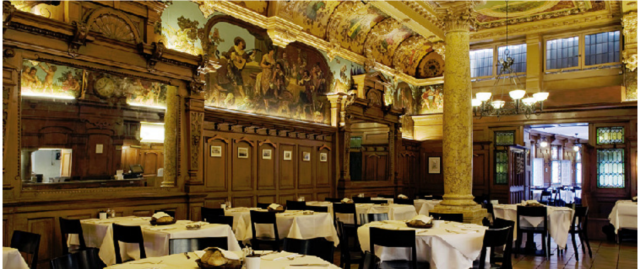
Kropf, In Gassen 16, 8001 Zürich