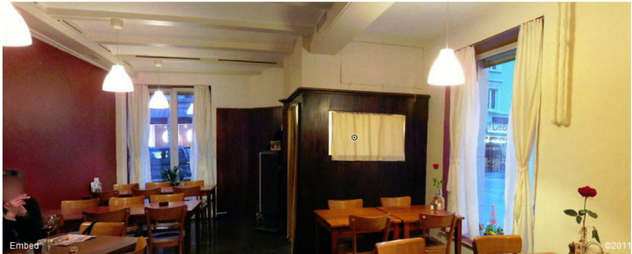
Nachtigall, Bäckerstr. 30, 8004 Zürich